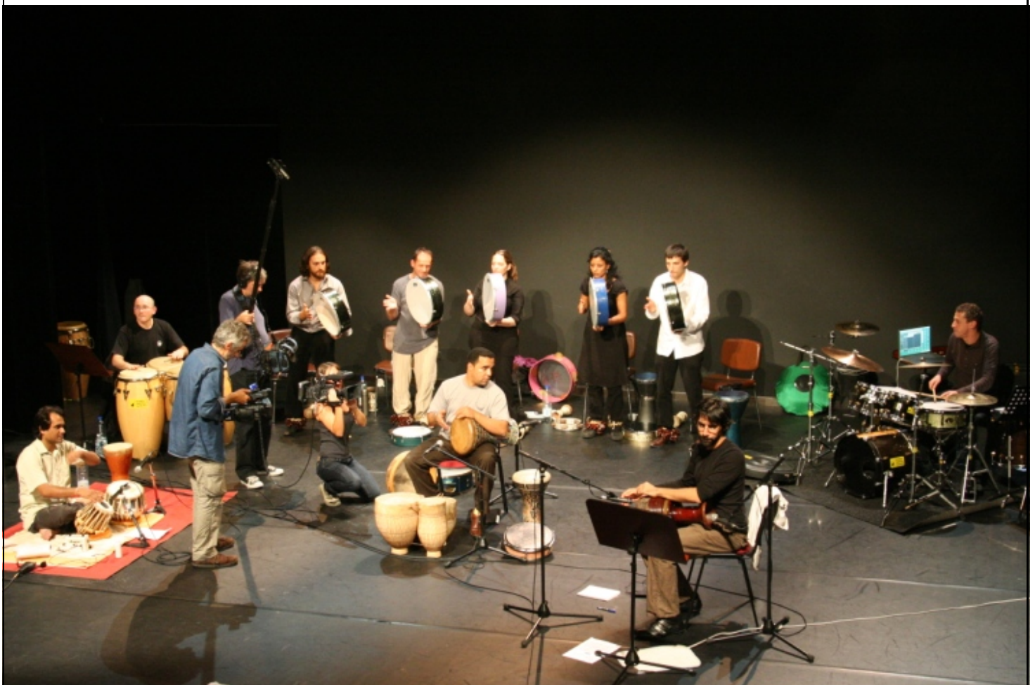
Le Pari d'Ali , Festival Jazz sur son 31, Toulouse, 2008