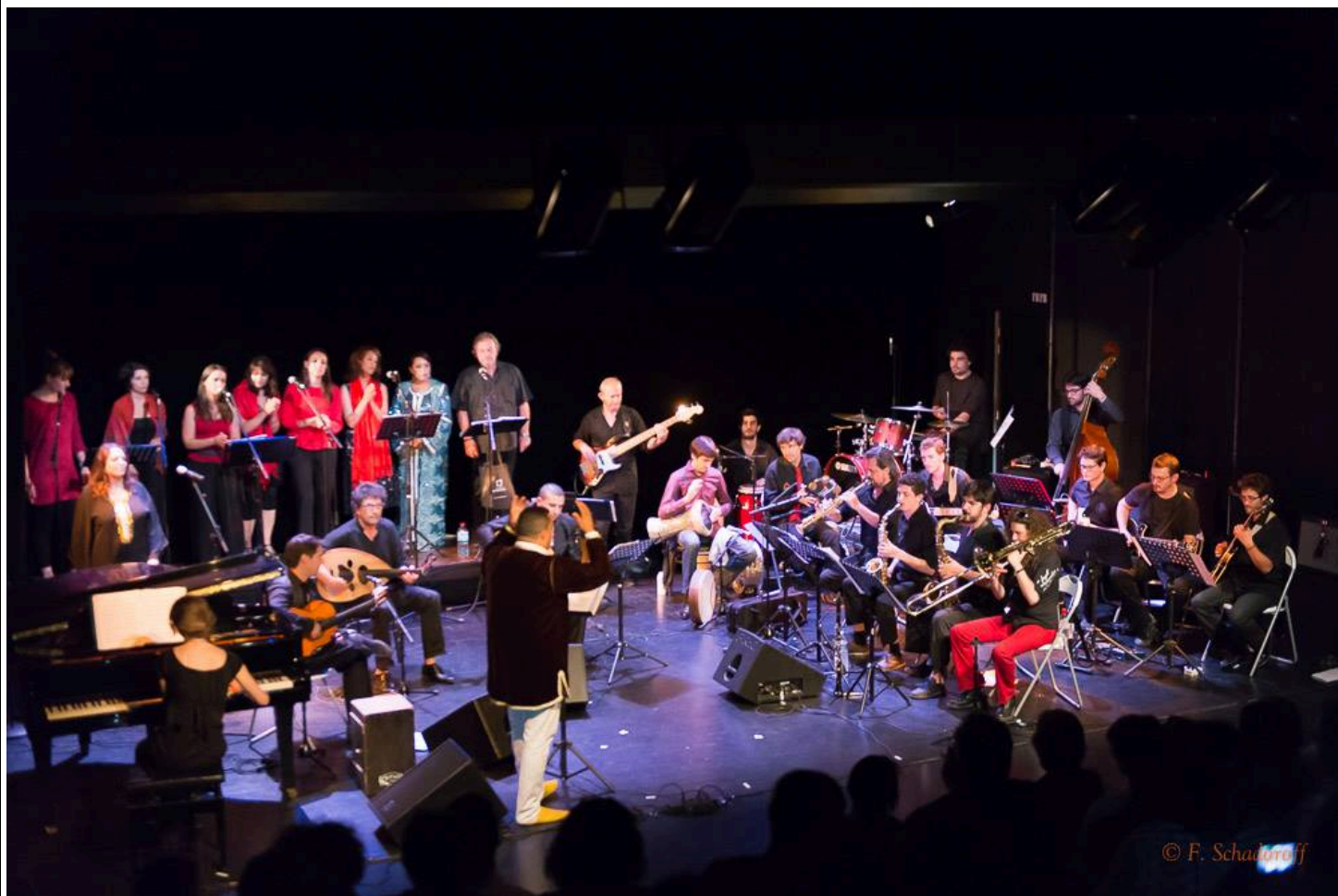
Marrakech la Rouge et Toulouse la Rose, Espace Job, Toulouse, 2015

Depuis 2019 il propose des interventions dans les écoles de la ville de Toulouse dans le cadre du Passeport pour l'art sur le thème : Initiation à la musique andalouse : une approche par le rythme.